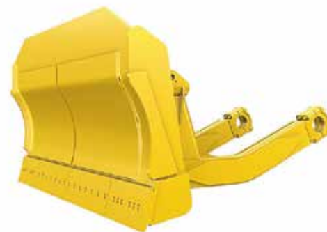
Cuchilla de Amortiguación