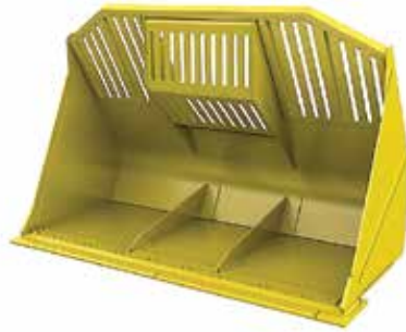
Balde para desechos