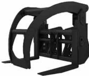
Tenedor para maderos