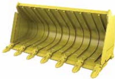
Balde para escorias