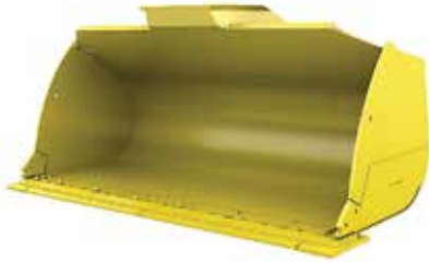
Balde de manejo de materiales